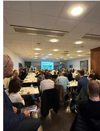
Bilder fra frokostmøte 2023

Kandidattreffet er en møteplass for mastergradsstudenter i samfunnsøkonomi og virksomheter som ønsker å rekruttere samfunnsøkonomer. Det første kandidattreffet fant sted i februar 2009 og har nå blitt et årlig arrangement. Kandidattreffet 2023 ble arrangert på Meet Ullevål og ble utvidet til studenter på bachelornivå. I 2023 deltok til sammen 170 personer, hvor 120 av disse var studenter og 50 kom fra bedriftene. Det var 12 virksomheter fra offentlig og privat sektor deltok. Evalueringen viser at dette er et meget populært arrangement både for studentene og bedriftene.