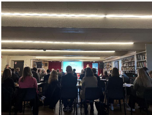
Bilde fra høstkonferansen 2023

For 2020 og 2021 var det i tillegg et betydelig antall digitale deltakere.